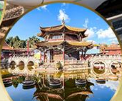
วัดหยวนทอง