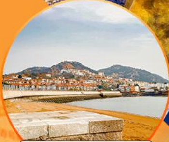
ซาจื่อโป