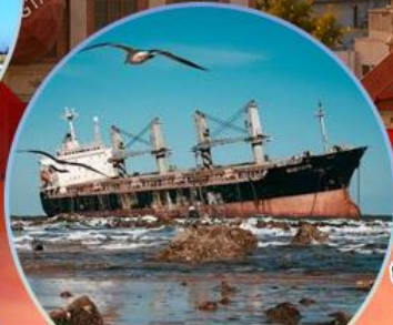
เรืออัปปาง Blueways