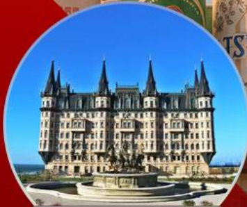
คฤหาสน์เวินเจิง