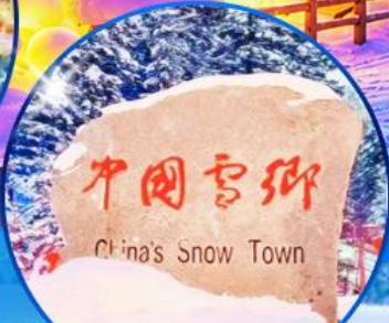
ป้ายหินใหญ่เมืองหิมะ