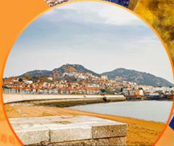
ซาจื่อโป่ว