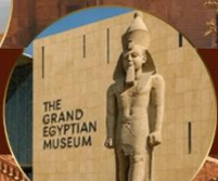
พิพิธภัณฑ์แกรนด์อียิปต์