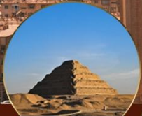
พีระมิดชั้นบันได