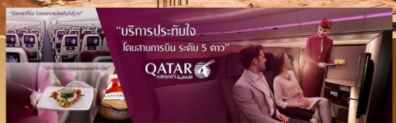
"บริการประทับใจ โดยสายการบิน ระดับ 5 ดาว"