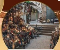
ตลาดย่านเอลคาลลี