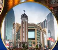
ถนนคนเดินเจียฟางเป่ย์