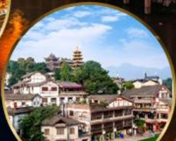
เมืองโบราณฉือจี้โข่ว