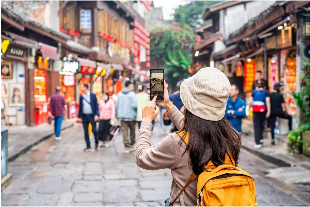
จากนั้น ออกเดินทางสู่ มหานครฉงชิ่ง (ใช้เวลาเดินทางประมาณ 2 ชั่วโมง)